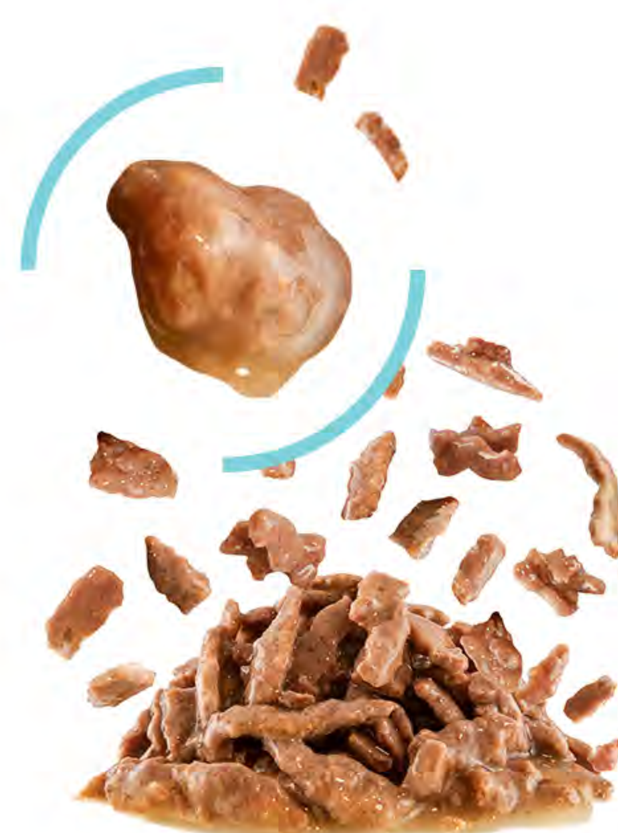
KOUSKY VE ŠŤÁVĚ

...která je krémovější, jemnější a lépe pokrývá kousky krmiva. Nová technologie "přirozeného natrhání" krmiva vytváří cárovité kousky připomínající kousky masa, jež kočku povzbuzují k dalšímu krmení.