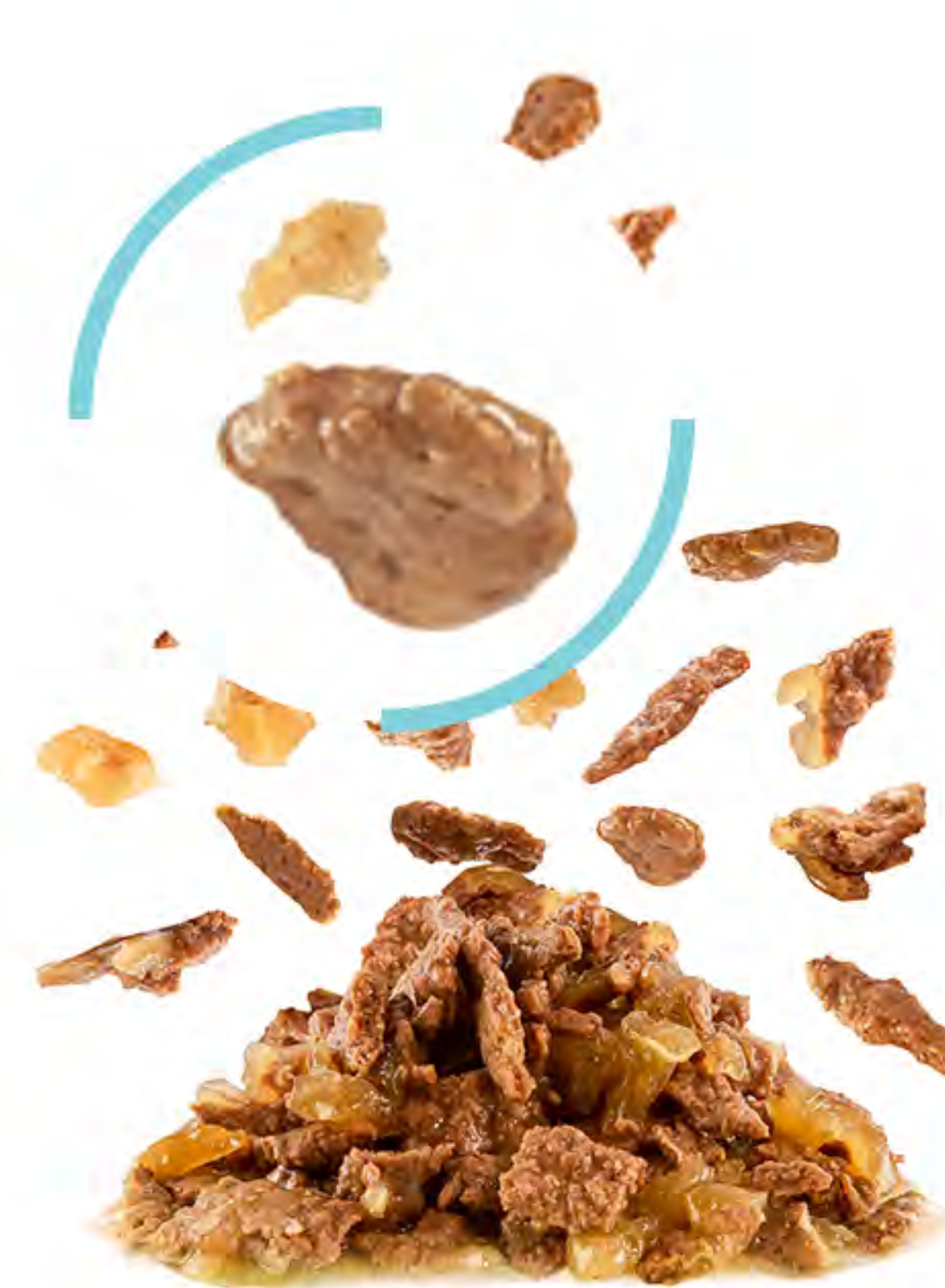
KOUSKY V ŽELÉ