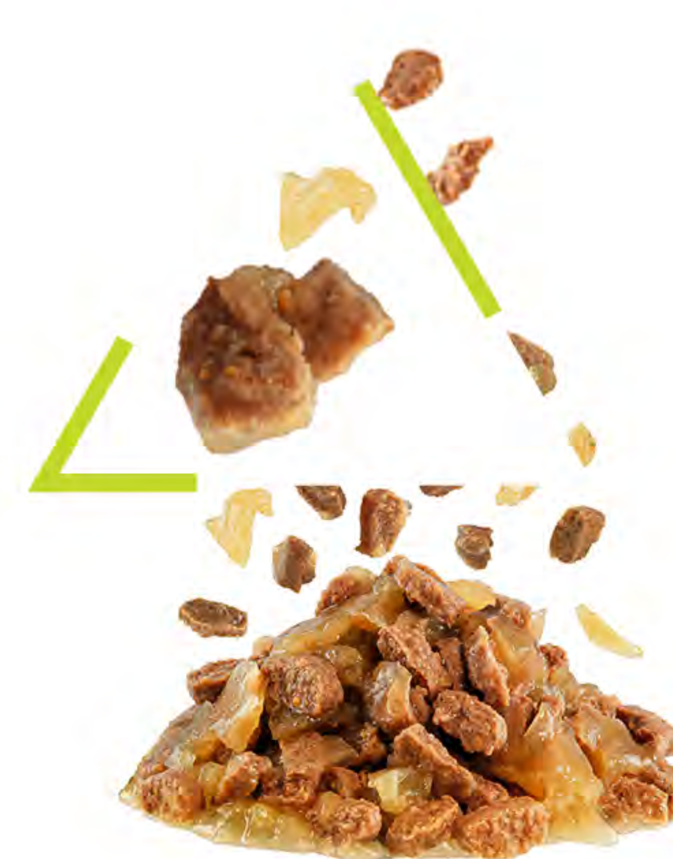
KOUSKY V ŽELÉ