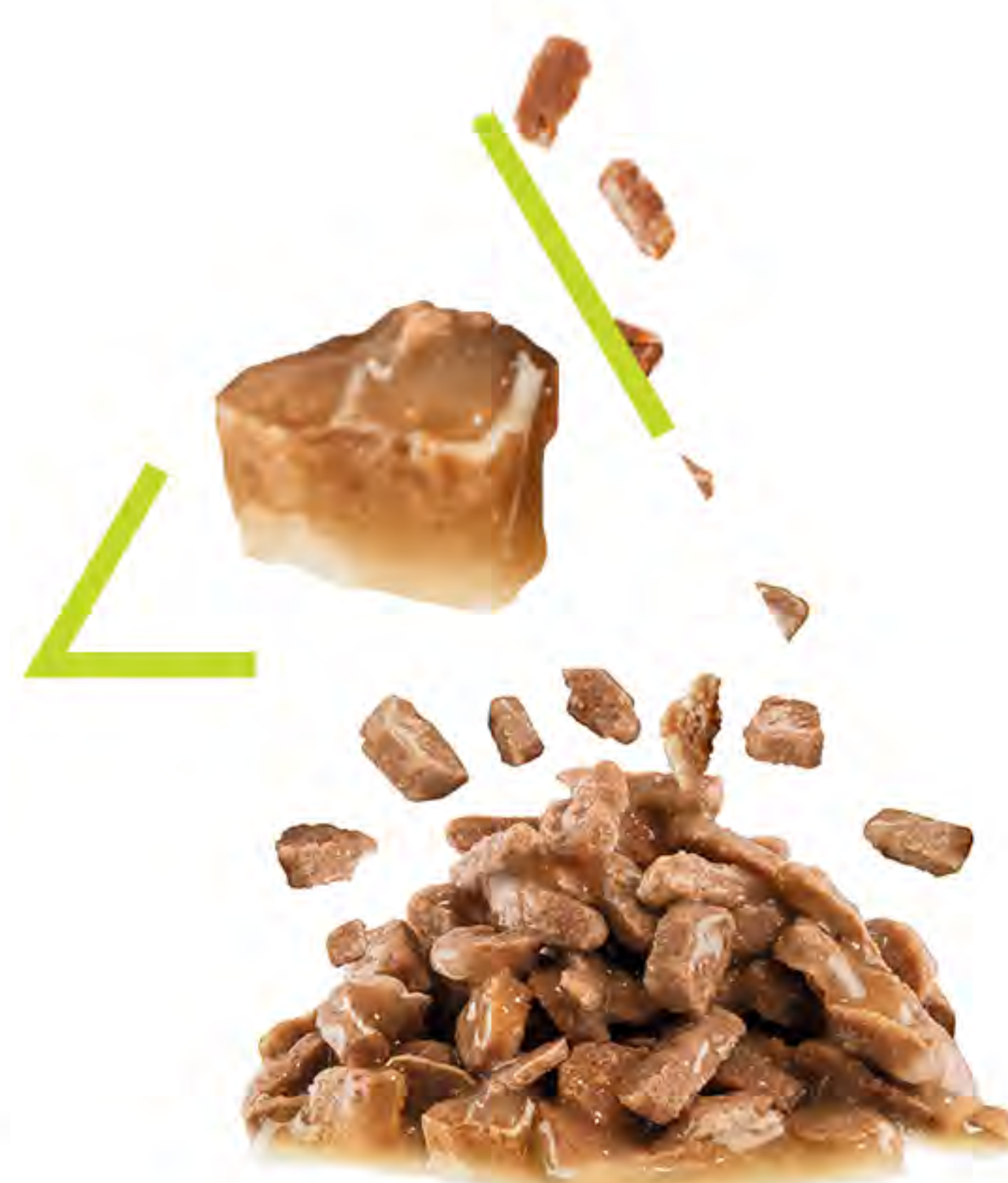
KOUSKY VE ŠTÁVĚ

...která je krémovější, jemnější a lépe pokrývá kousky krmiva. Složení krmiva má přitažlivý aromatický profil, jenž stimuluje kočičí čich.